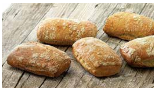
Mini xapates 4 x 70 g 2,20€