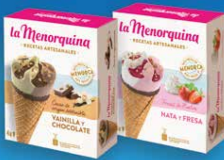
Cons 4 u. NATA/MADUIXA 5,90€ VAINILLA/XOCOLATA 5,90€