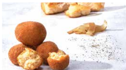
Mini croqueta de pollastre 16 unitats