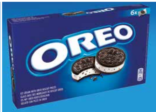
Sandwich Oreo 6 unitats