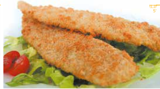
Filet de lluç empanat 625 g 5 peces 10,90€