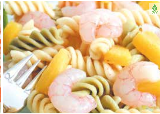
Ensalada de pasta 500 g 5,70€