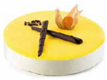
Pastís de llimona 17,40€ 600 g