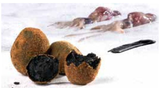
Croqueta de calamars amb tinta 8 unitats