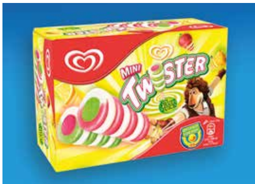
Mini Twister 8 unitats