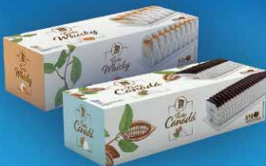
CROCANT 800 ml 9,60€ CANADÀ 1 litre 6,60€ WHISKY 1 litre 7,20€