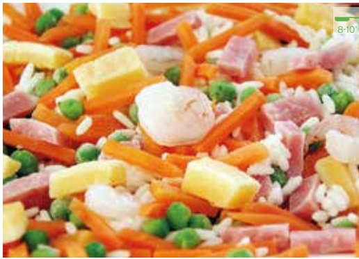
Arròs 5 delícies 1 kg 6,40€