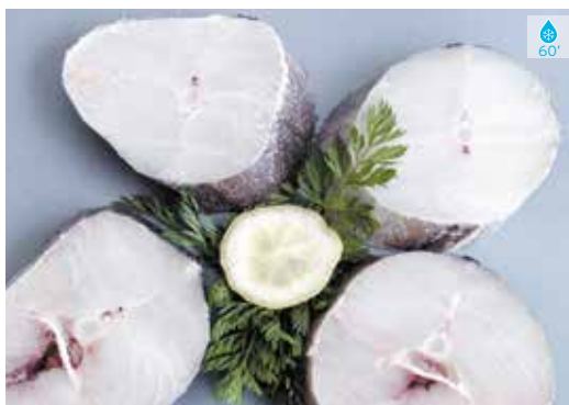
Lluç austral rodanxes 800 g 13,80€