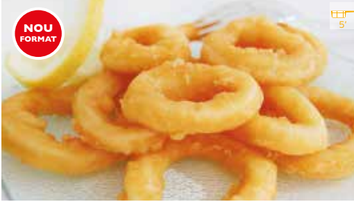
NOU FORMAT Calamars romana extra 400 g 11,80€