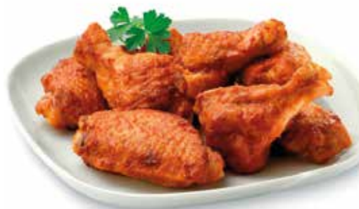
Aletes de pollastre al grill 60 g