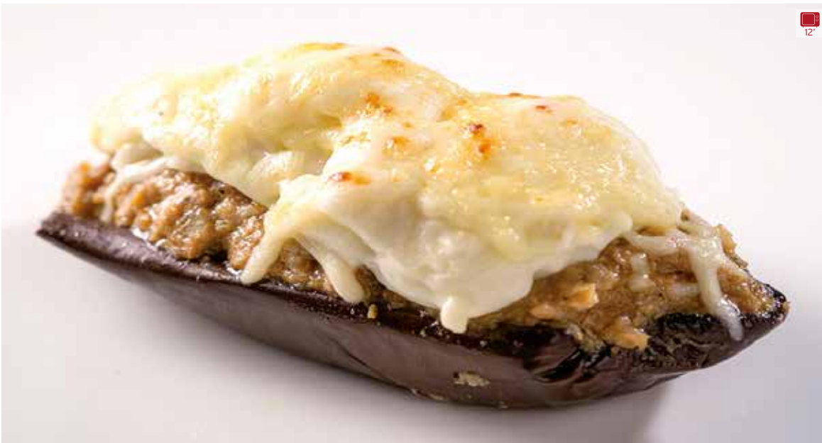
Albergínia farcida de carn 220 g