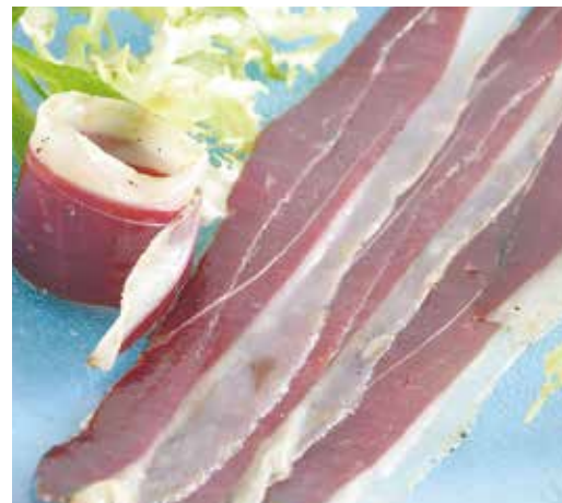
Pernil d'ànec 50 g