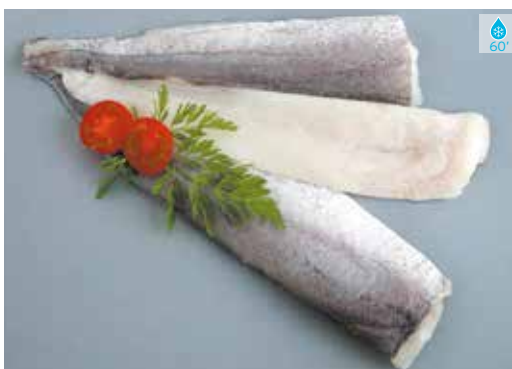
Filet lluç extra 9,60€ AMB PELL 800 g 11,90€ SENSE PELL