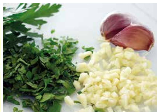
All 250 g 3,30€ Julivert 250 g 2,10€