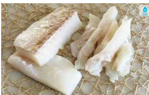
Filet de bacallà (talls) 1 kg 10,70€ Bacallà esqueixat 500 g 9,60€