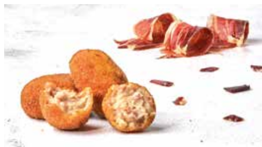
Croqueta de pernil ibèric 8 unitats