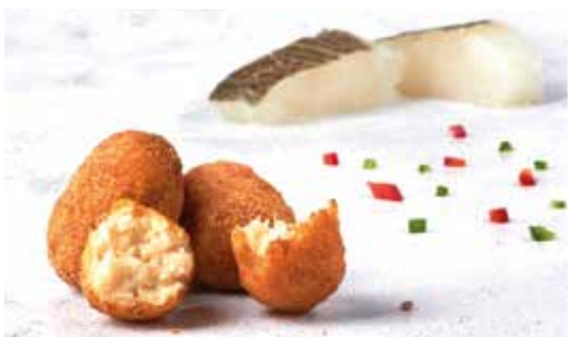
Croqueta de bacallà d'Islàndia 8 unitats