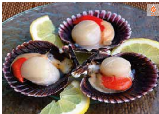
Vieira mitja closca 10 u. 19,80€