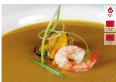
Sopa de peix 300 g