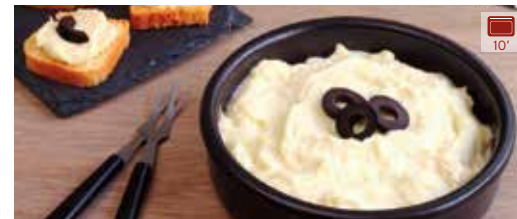
Brandada de bacallà 200 g 6,10€