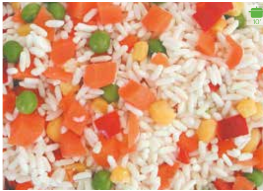
Ensalada d'arròs 1 kg 3,60€