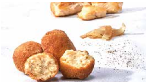
Croqueta de pollastre 8 unitats