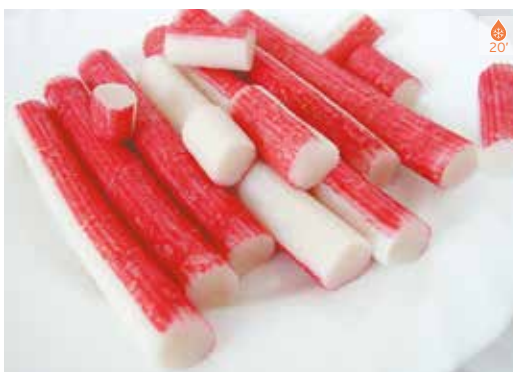
Delícies de mar 250 g 3,90€ 1 kg 15,80€