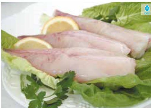
Rap 1 kg CUETES 22,80€ RODANXES 800 g 29,80€