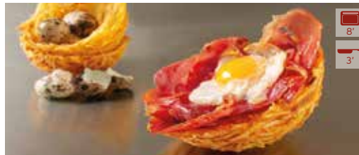
Niu de patata 6 u. 78g 11,80€