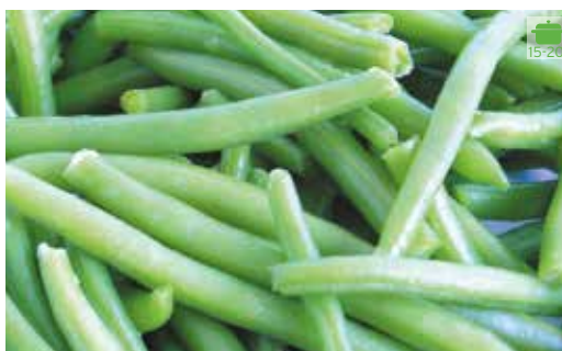
Mongeta verda PERONA 3,10€ 1 kg FINA 4,30€