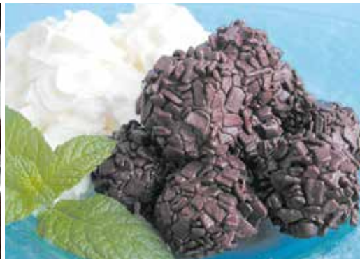
Trufes 12 unitats