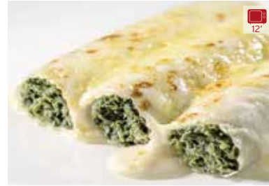
Canelons d'espínacs 3 unitats