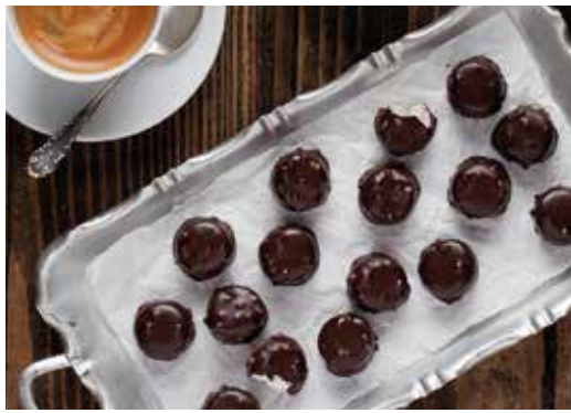
Bombons 10 unitats