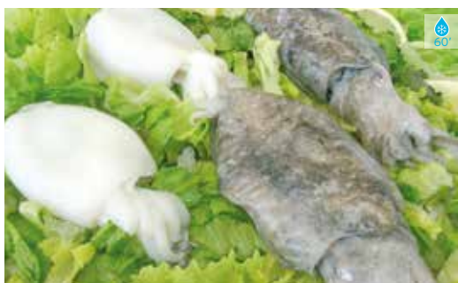
Sèpia neta 800 g PETITA 17,80€