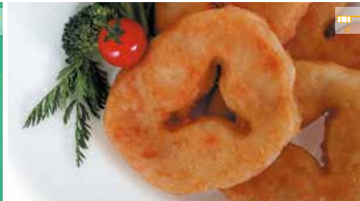
Rodelles de lluç arrebossat 450 g (aprox.) 5 peces 8,30€