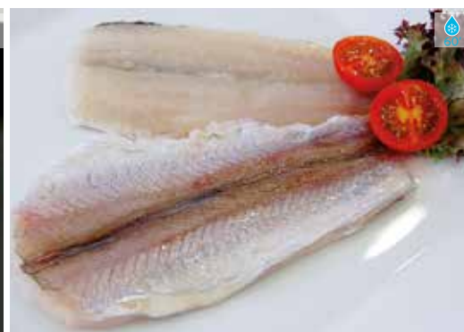
Filet de Maira 800 g 9,70€