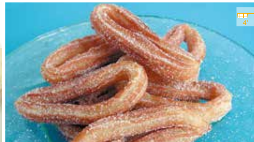
Xurros 500 g 2,20€