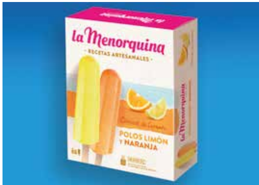
Polos taronja / llimona 5 + 5 unitats