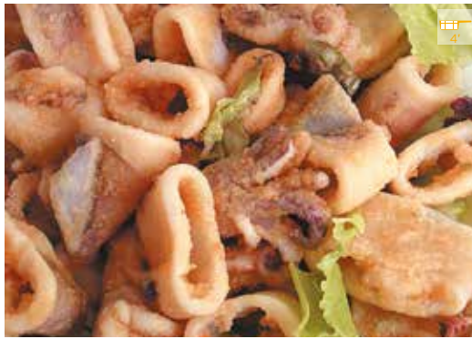
Xipiró enfarinat 500 g 13,40€