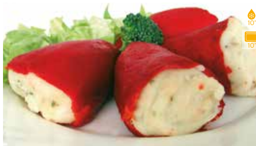
Pebrots farcits de bacallà 8 u 7,80€