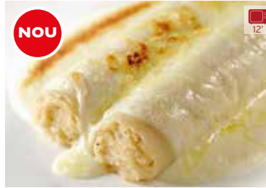
NOU Canelons de peix i marisc 2 uni. (XL)