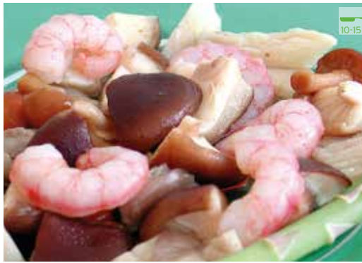
Barrejat de gambes i bolets 500 g 5,30€