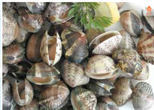
Cloïsses fines 500 g