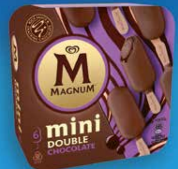
Mini Double Chocolate 6 u. 6,60€