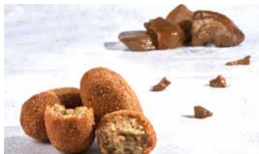
Croqueta de ceps 8 unitats