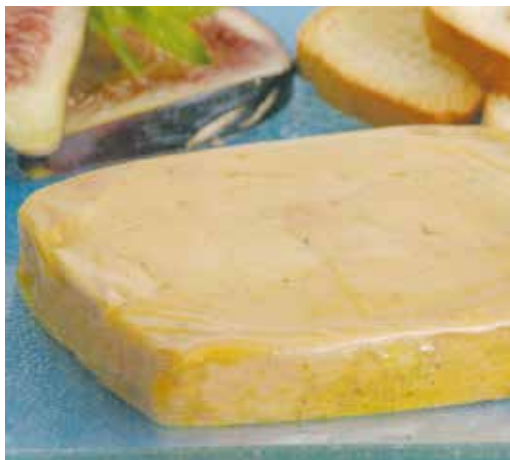
Foie Micuit 60 g