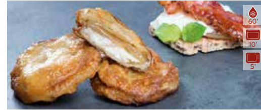
Patata farcida FORMATGE DE CABRA I CEBA 10 u. 13,10€