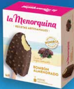
Bombó ametllat 6 unitats 5,90€