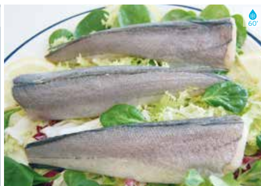
Llucet sense cap 1 kg 6,90€