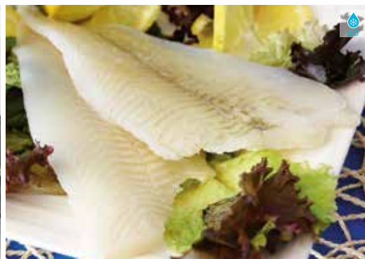
Filet de limanda 800 g 11,50€