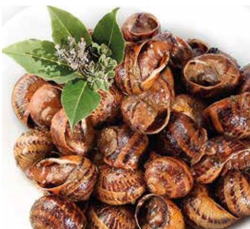
Fines herbes 250 g