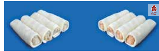
Canelons casolans CARN 10 u. 9,50€