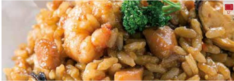
Arròs de marisc 175 + 410 g