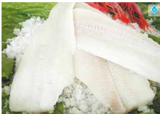
Filet de fletan 800 g 16,20€