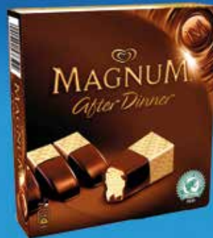
Magnum After Dinner 10 u. 6,60€