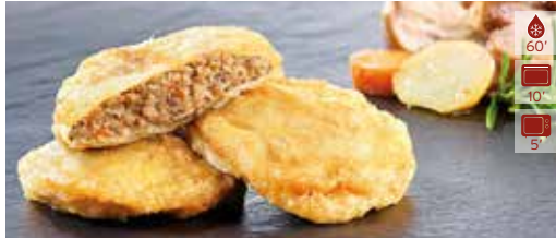
Patata farcida CARN 10 u. 13,90€