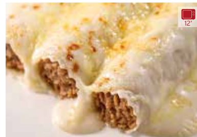
Canelons de carn 3 unitats