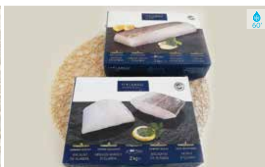
Bacallà supremes 800 g 23,60€ Bacallà supremes 2 kg 49,80€ Llom bacallà iceland 2 kg 64,00€