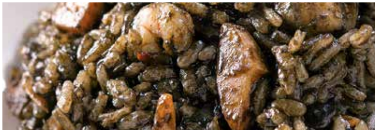
Arròs negre 175 + 410 g