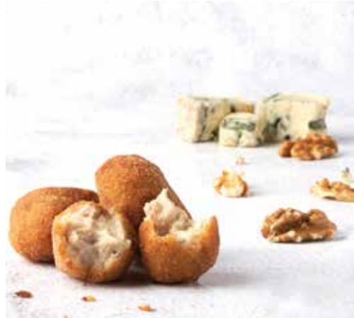
Croqueta de Gorgonzola i nous 8 unitats