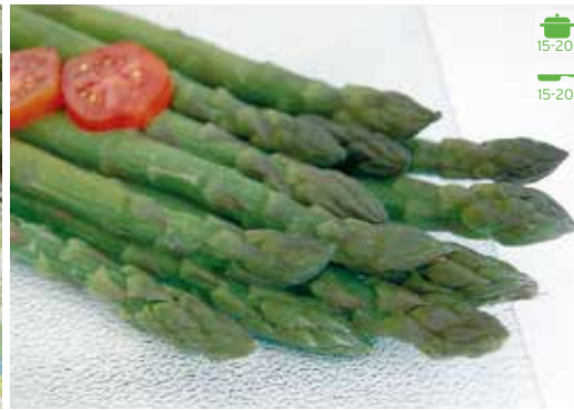
Espàrrecs M 1 kg 11,80€