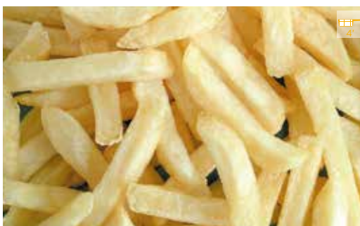
Patates precuïtes 1 kg 3,60€ 2,5 kg 9,40€ JULIENNE 2,5 kg 10,40€