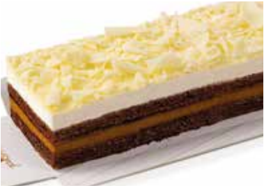
Lingot mango i maracuyà 10,90€ 350 g