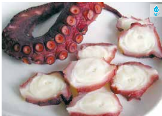
Pop cuit potes 250 g 18,80€