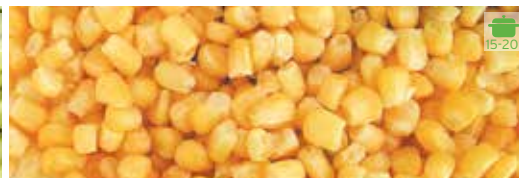
Blat de moro 1 kg 5,40€