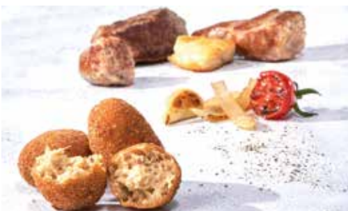
Croqueta de rostít 8 unitats