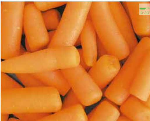
Pastanaga Baby 1 kg 4,30€