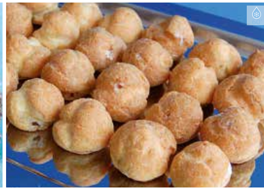
Lioneses de nata 500 g