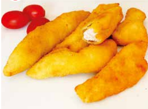
Tires de pollastre arrebossades 500 g