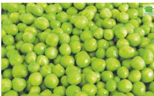
Pèsols PÈSOL FI 1 kg 3,60€ PÈSOL FINDUS 200 g 2,80€ PÈSOL MOLT DOLÇ 1 kg 5,10€