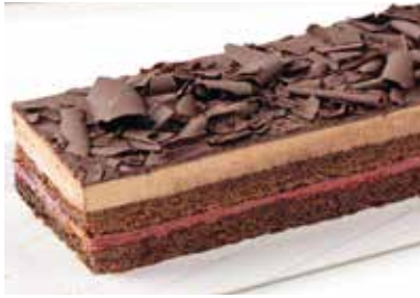
Lingot xocolata i gerds 9,90€ 350 g