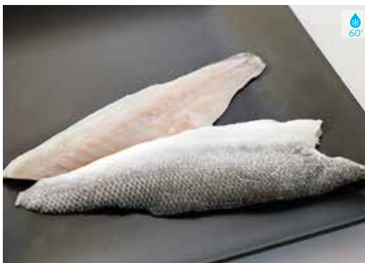
Filet de llobarro 500 g 11,60€