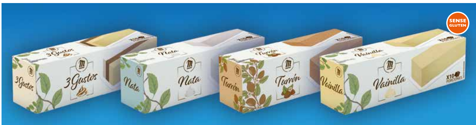
Barres de gelat 1 litre