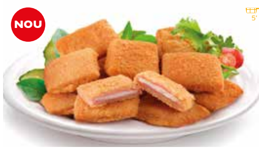
NOU Mini San Jacobo 260 g 13 unitats 3,00€