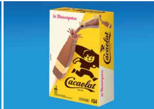
Cacaolat 4 unitats