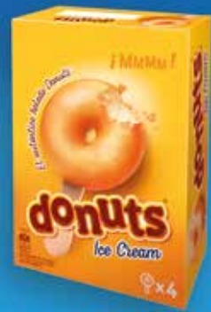
Donuts Ice Cream 4 u. 6,60€