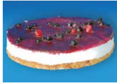
Pastís formatge amb nabius 14,20€ 500 g