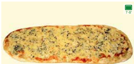
SALSA DE TOMATA, MOZZARELLA, EMMENTAL, BLAU I GORGONZOLA