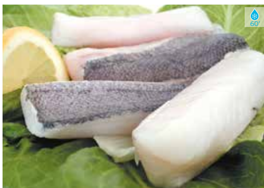
Llom de lluç 800 g 15,40€