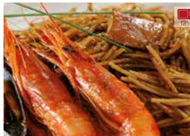
Fideuà 80 + 465 g