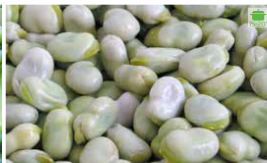
Faves Baby 1 kg 7,30€ Faves SuperBaby 1 kg 11,70€