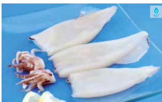
Calamar net n. 4 500 g 10,80€ Calamar net n. 3 800 g 18,90€ Calamar talls 800 g 13,10€