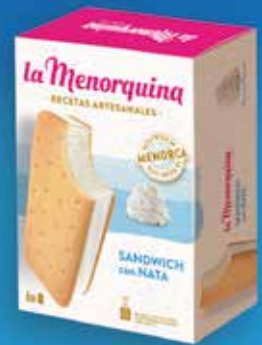
Sandwitch nata 6 unitats 5,90€