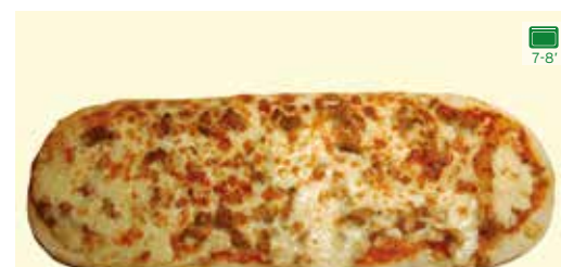
SALSA DE TOMATA, MOZZARELLA I TONYINA