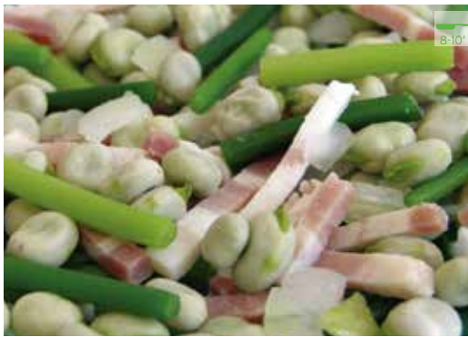
Saltejat favetes amb bacó 500 g 6,10€