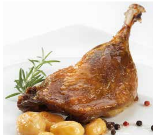
Cuixa d'ànec confitat 250 g