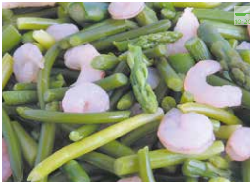
Remenat d'alls 500 g 6,80€