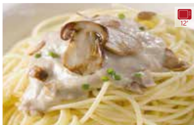
Espaguetti carbonara 350 g