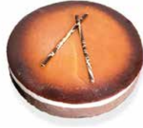
Pastís de nata, trufa i gema 17,40€ 740 g