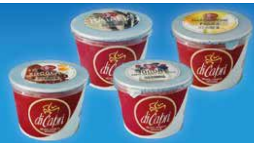
Pots 500 ml 9,60€ Xocolata & Taronja, logurt & Gerds del bosc, Cafè, Mascarpone & Figs