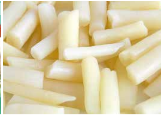
Salsafins 1 kg 5,90€