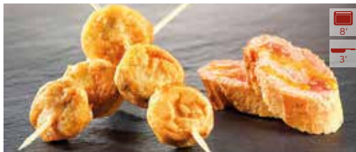
Patata cocktail 25 unitats 14,30€