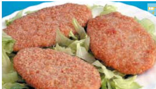
Pollastre empanat 480 g (aprox.) 5 peces 6,50€