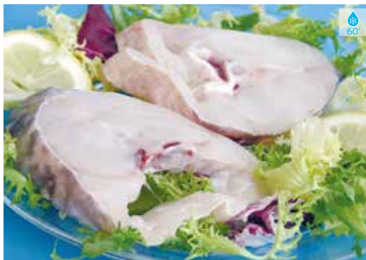
Rosada rodanxes 800 g 15,80€