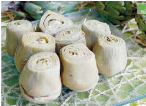
Cors de carxofa 1 kg 10,90€ Cors de carxofa Baby 1 kg 16,60€