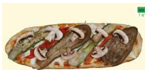
SALSA DE TOMATA, MOZZARELLA, EMMENTAL, ALBERGÍNIA, CARBASSÓ, PEBROT VERMELL ESCALIVAT, XAMPINYONS I ORENGA