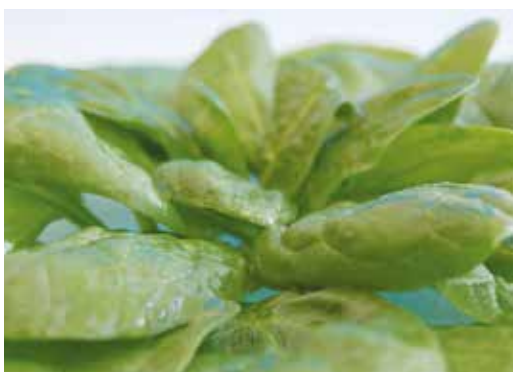
Espinacs PASTILLA 400 g 3,20€ DAUS 1 kg 3,10€