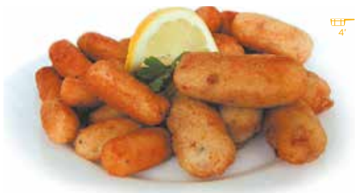
Croquetes 1 kg POLLASTRE 7,20€ PERNIL 7,20€ BACALLÀ 7,20€ MINI PERNIL 500 g 3,90€