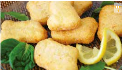
Nuggets 1 kg 12,10€