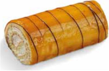
Bracet Nata/Gema 7,40€ 280 g