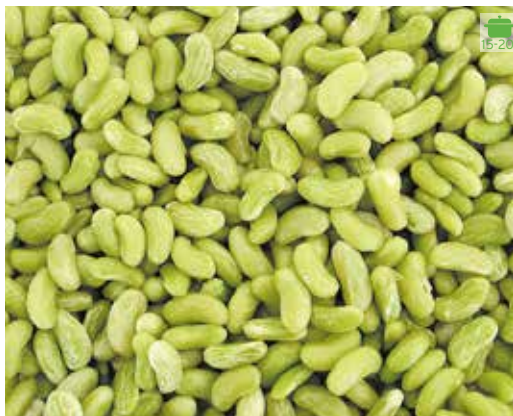
Fesolets 1 kg 5,80€