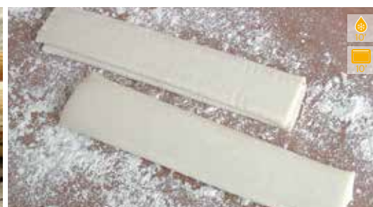
Pasta de full 500 g 4,90€