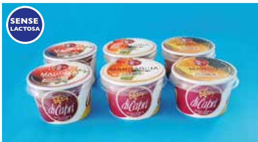
Sense Lactosa Sorbet 6 u. x 125 ml 9,60€ Maduixa, mandarina, mango