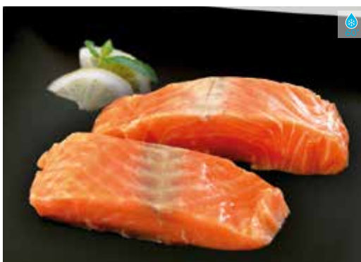
Llom de salmó 4 u. 500g 20,60€