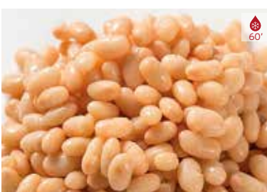
Mongetes 400 g