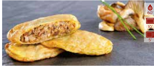
Patata farcida BOLETS 10 u. 12,80€