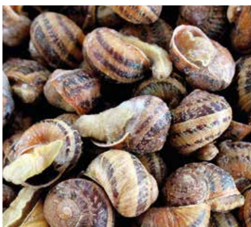
Bover 1 kg