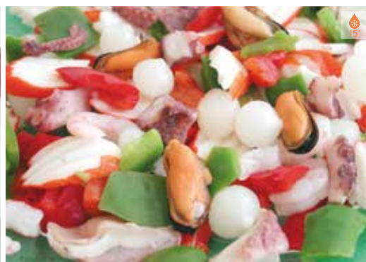
Salpicó marisc 500 g