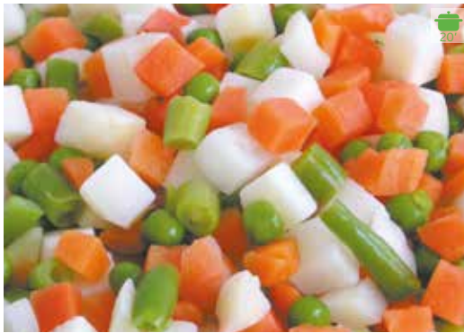
Ensalada 1 kg 2,60€