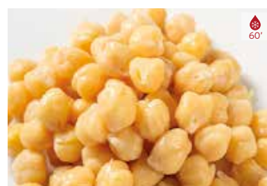
Cigrons 400 g