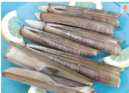
Navalles 500 g