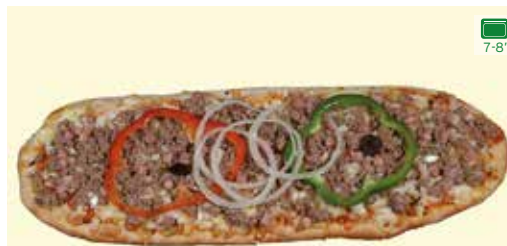
SALSA MEXICANA, MOZZARELLA, EMMENTAL, CARN DE VEDELLA I PORC ESPECIADES, PEBROT VERMELL I VERD, CEBA I OLIVES