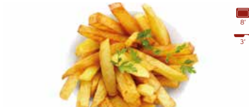
Patata fregida casolana 10,70€ 1,5 kg