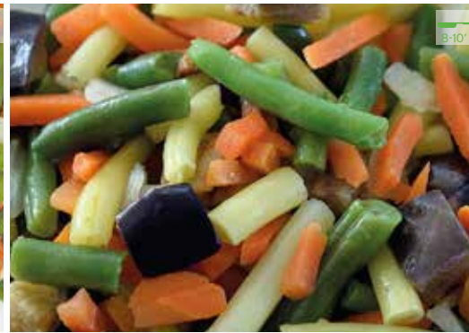
Saltejat de verdures 1 kg 5,20€