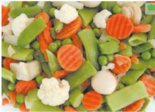
Minestra Imperial 1 kg 4,60€