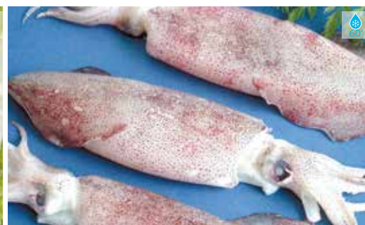
Calamar n. 3 FARCIR 800 g 18,80€