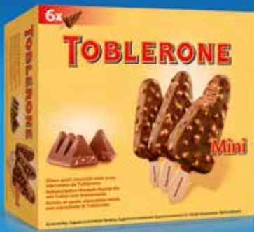
Mini Toblerone 6 unitats 7,60€