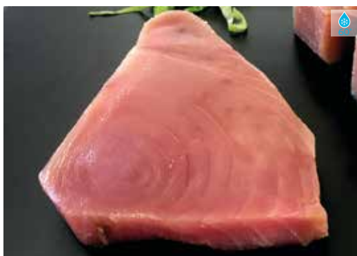
Tonyina rodanxes 2 u. 225 g 7,60€