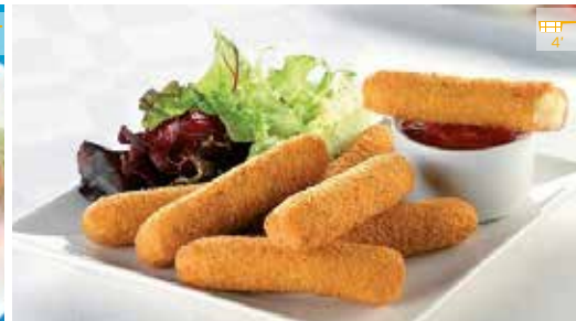
Fingers de formatge 500 g 8,40€