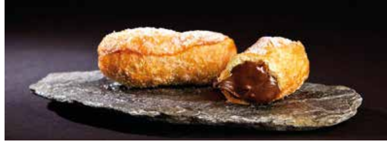
Xuixo Xocolata 4 u. x 50 g 10,60€