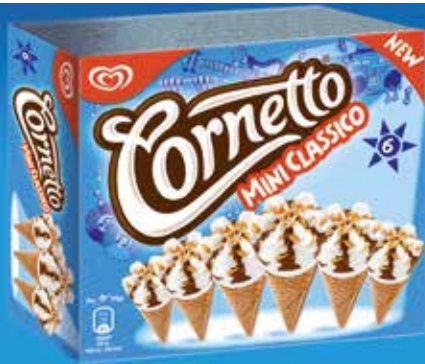
Mini cons 6 unitats 5,70€