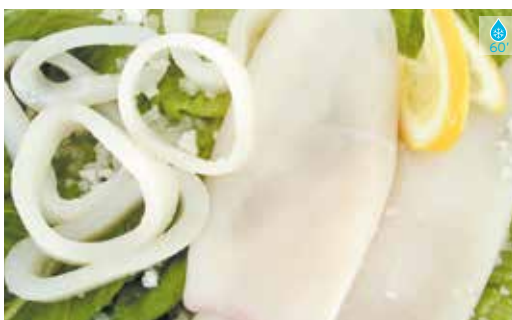
Calamar anelles 750 g 13,60€