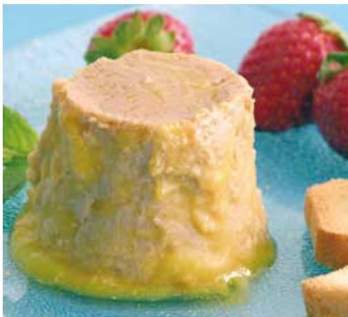
Tarrina mousse de foie 100 g