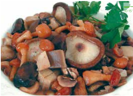
Barrejat de bolets 1 kg 7,60€