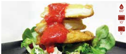
Patata farcida BRANDADA BACALLÀ 10 unitats 15,40€