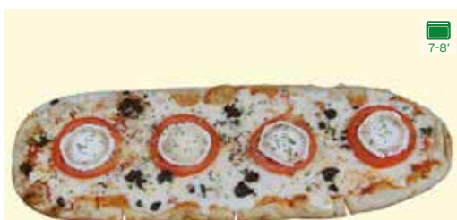
SALSA DE TOMATA, MOZZARELLA, EMMENTAL, RODELLES DE TOMATA, FORMATGE DE CABRA, MUS DE SALMÓ, OLIVADA I ORENGA