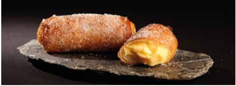
Xuixo Crema 4 u. x 50 g 10,60€