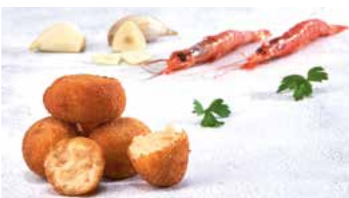
Mini croqueta de gambes amb all i julivert 16 unitats