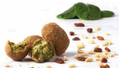
Croqueta d'espínacs panses i pinyons 8 u