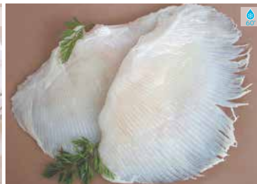
Clavellada TALLS 1 kg 12,80€