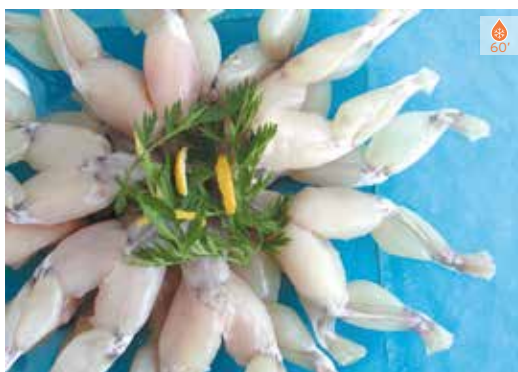
Cuixes de granota 1 kg 19,80€