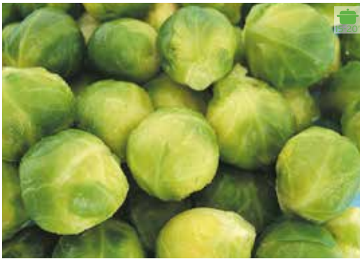
Cols Brusel·les 1 kg 3,40€