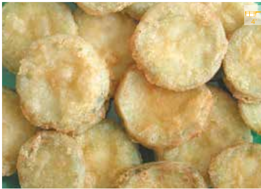
Carbassó arrebossat 1 kg 6,10€