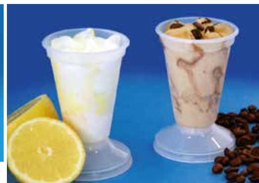
Copa 8,60€ 6 u. x 125 ml CAPUCCINO 8,60€ SORBET LLIM. 8,60€