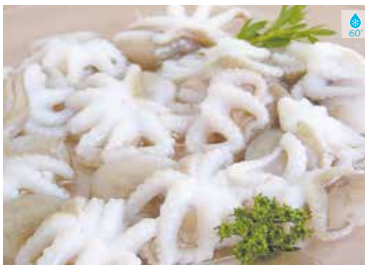
Popet 61/UP 1 kg 15,80€