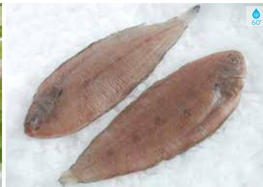
Llenguado Peça 9,60€ H. 4 MITJÀ SENSE PELL 9,90€