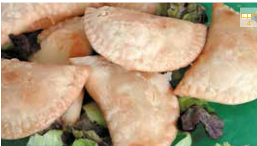
Crestes FORMATGE 10 u. 6,20€ TONYINA 500 g 4,30€