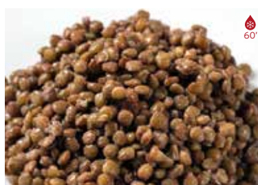
Llenties 400 g