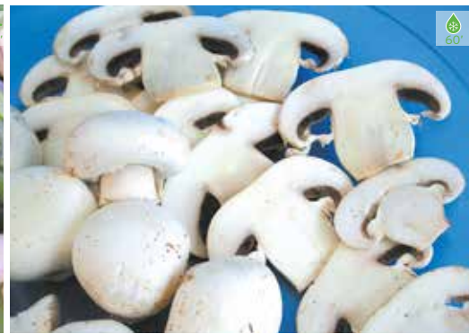
Xampinyons 1 kg LAMINATS 6,90€