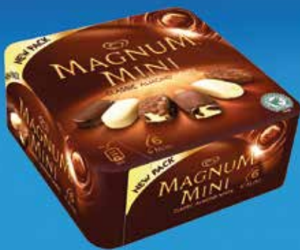
Mini Magnum 6 unitats 5,70€