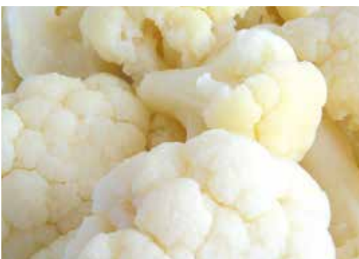
Bròquil 1 kg VERD 4,60€ BLANC 3,10€