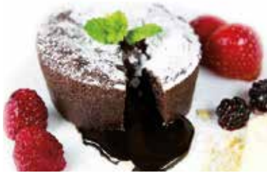
Coulant de xocolata 2 unitats 6,50€