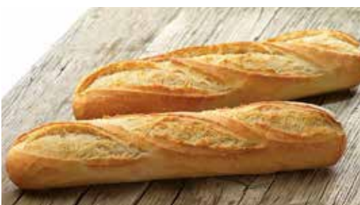
Baguetines 4 x 125 g 3,40€