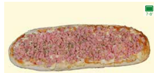
SALSA DE TOMATA, MOZZARELLA, EMMENTAL, PERNIL DOLÇ I ORENGA