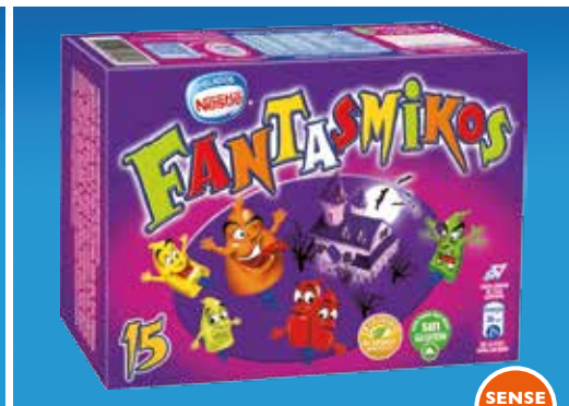
Fantasmikos 15 unitats