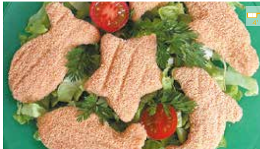
Peixets 500 g 5,20€