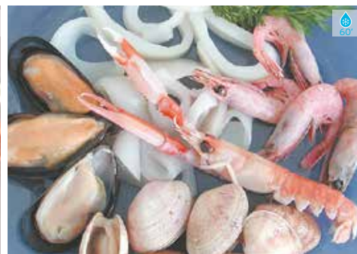
Preparat paella 480 g 8,90€