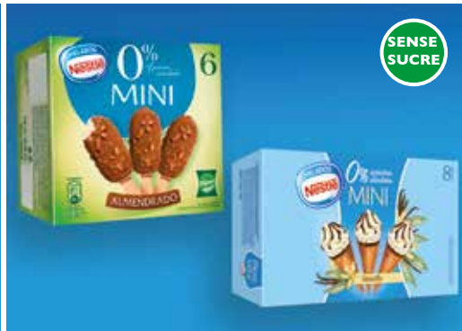
Mini Ametllat sense sucre 6 u