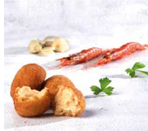
Croqueta de gambes amb all i julivert 8 unitats