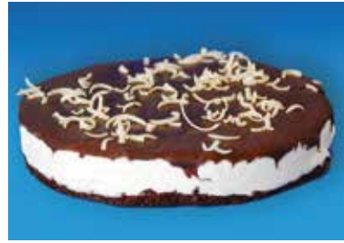
Pastís 3 xocolates 14,20€ 500 g