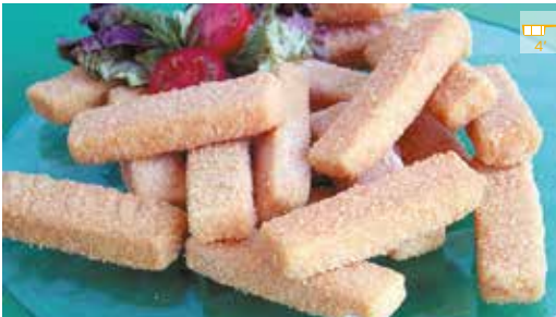
Varetes de lluç 500 g 5,30€