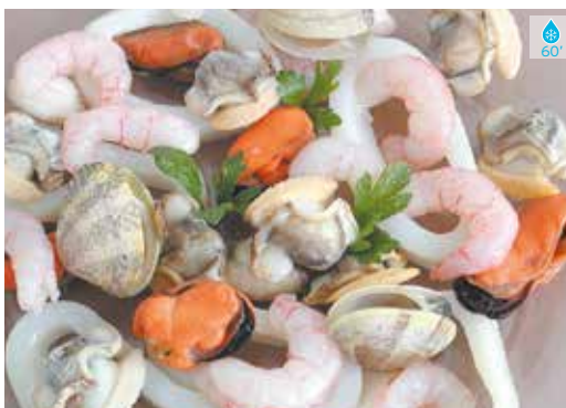
Preparat sopa marisc 330 g 6,60€