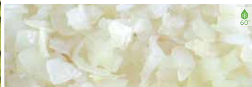
Ceba trossejada 1 kg 3,90€