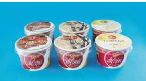
Gelat 6 u. x 125 ml 9,60€ Xocolata belga, vainilla, llimona