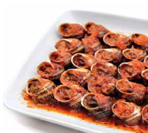
A la llauna 250 g