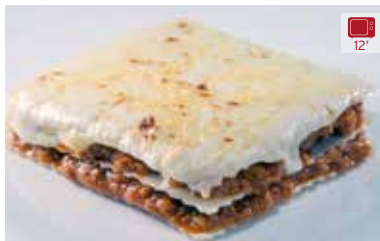
Lassanya 300 g CARN 6,40€ VERDURES 6,90€