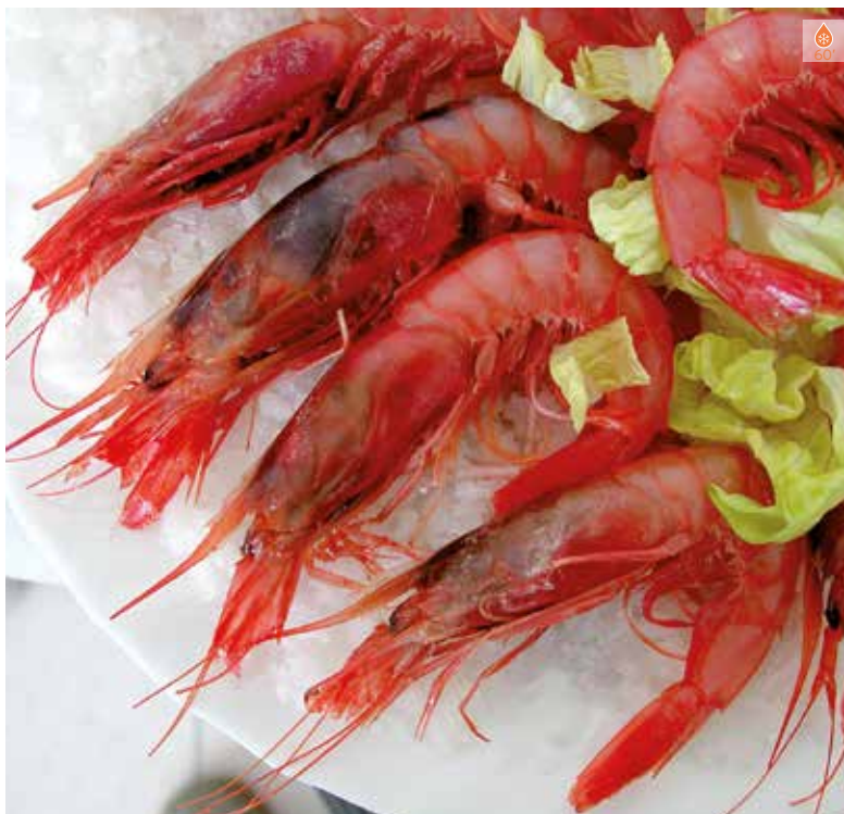
Gamba vermella Preu a consultar

GAMBA VERMELLA 500 g GAMBETA VERMELLA 500 g