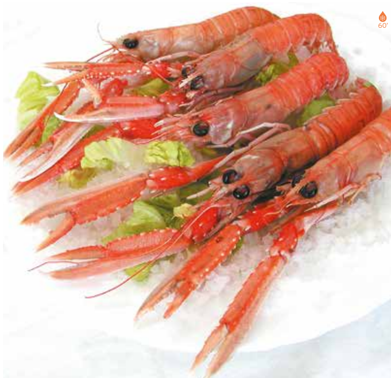
Escamarlà gros Preu a consultar

GAMBA VERMELLA 500 g GAMBETA VERMELLA 500 g